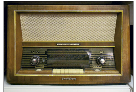
Radio Erfurt II aus DDR-Produktion der späten 1950er-Jahre