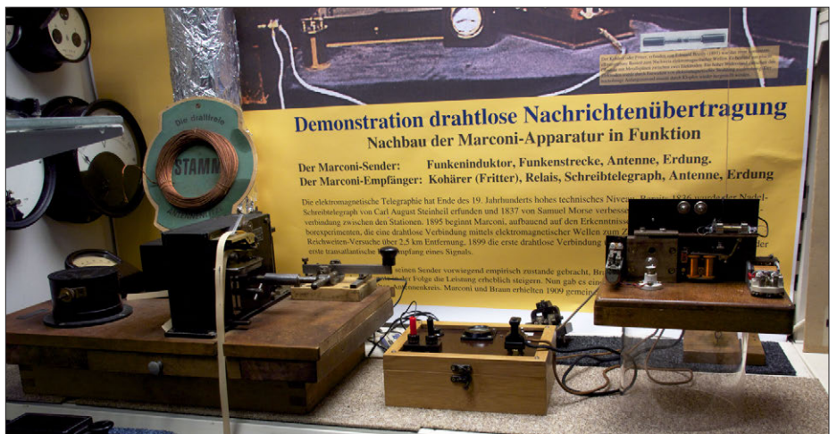
Nachbau der Marconi-Funkapparatur