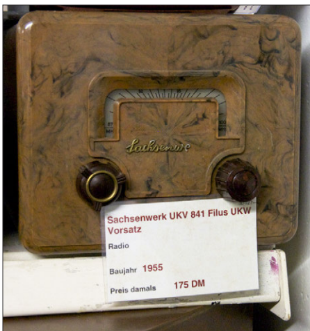
Gerate aus einer dunkleren Zeit