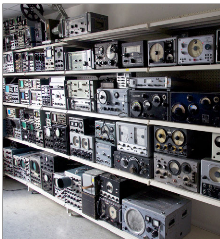
Teil der Messgerätesammlung