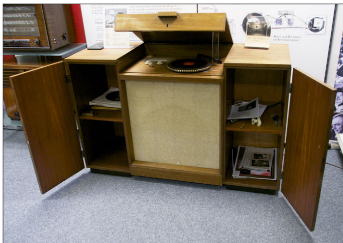
Siemens Kammer- musikgerät II