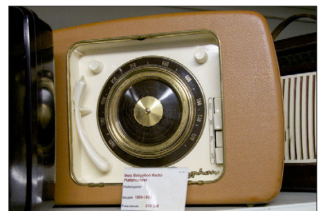
Metz Babyphon: eine tragbare Radio-Plat- tenspieler-Kombination von 1954