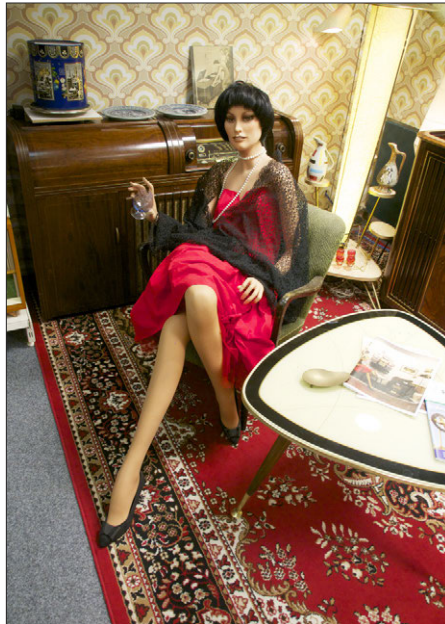
1950er-Jahre-Design mit Nierentisch

An dieser Stelle noch weitere Bilder zum Beitrag, die in der gedruckten Ausgabe keinen Platz mehr fanden.