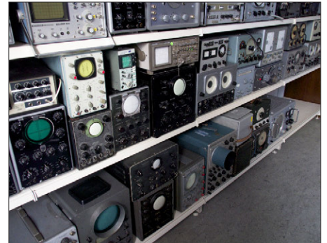
Teil der Messgerätesammlung